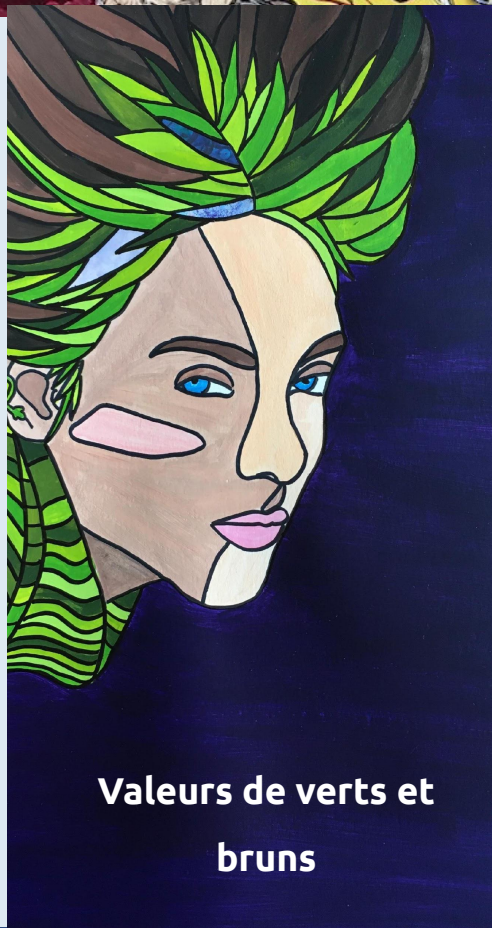
Valeurs de verts et bruns

Exemples de réalisations d' élèves en peinture