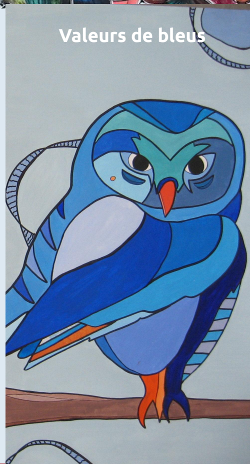
Valeurs de bleus

Exemples de réalisations d' élèves en peinture