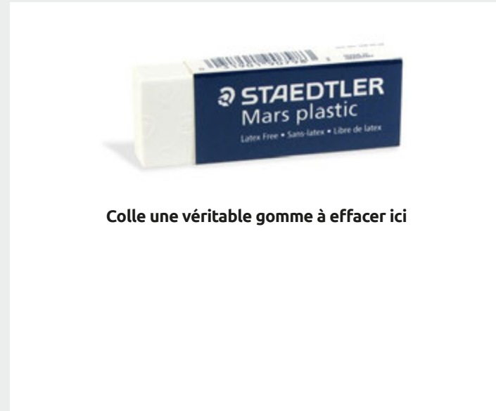
Colle une véritable gomme à effacer ici